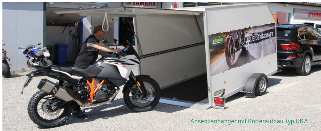
Absenkanhänger mit Kofferaufbau Typ UKA